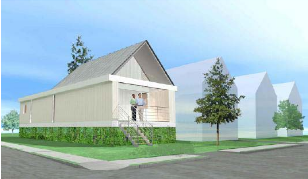
S h i g e r u B a n