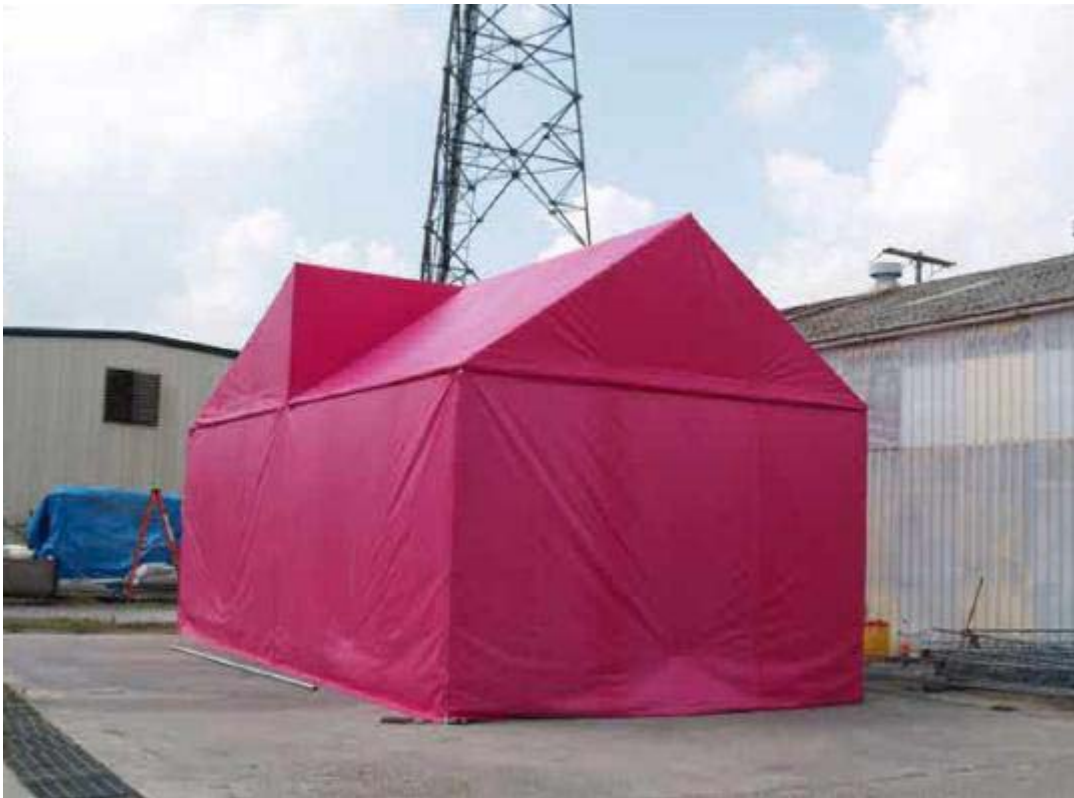
P i n k P r o j e c t