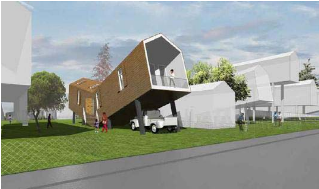
M V R D V