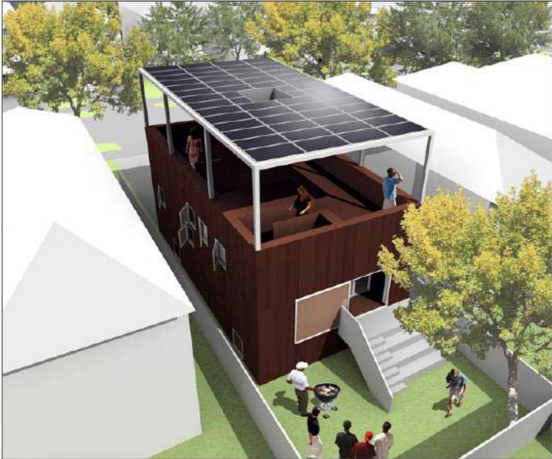
A d j a y e