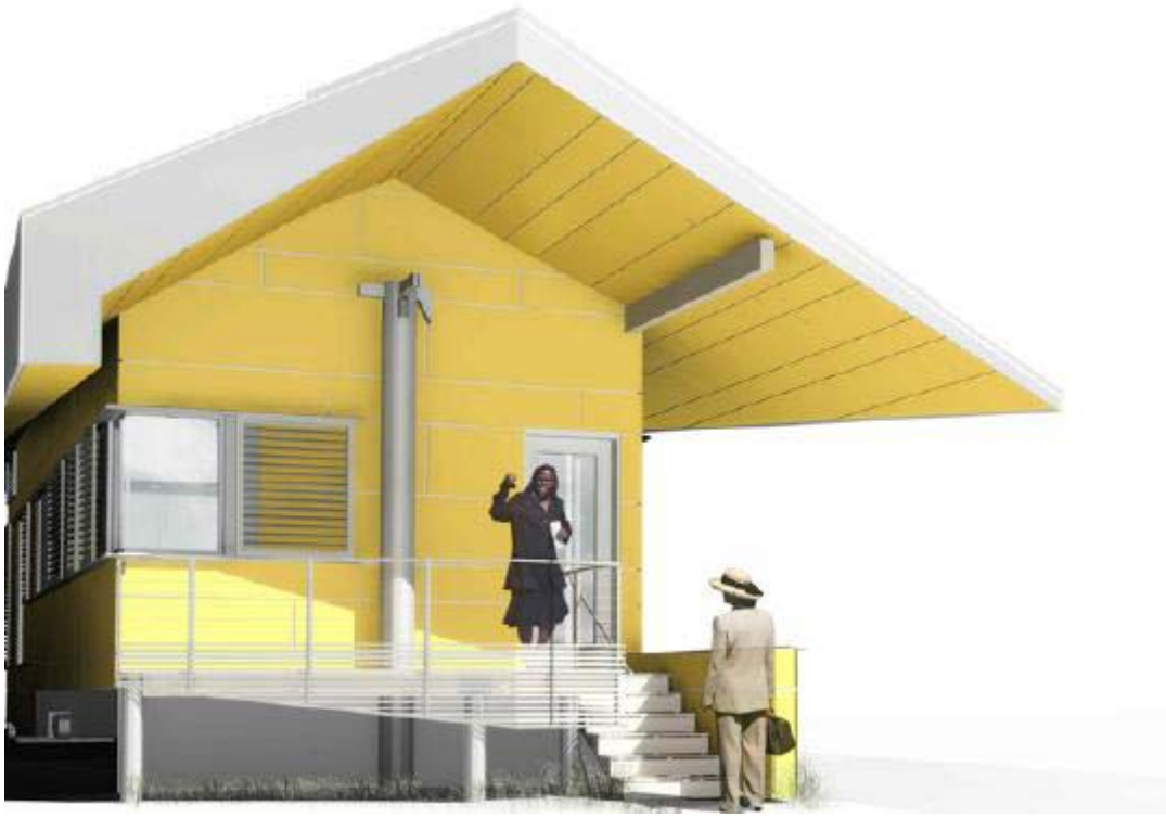
M o r p h o s i s