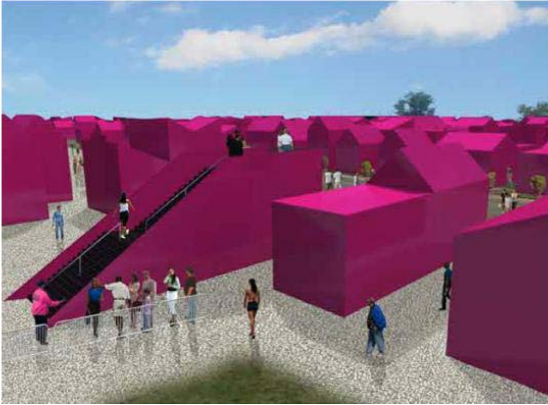
P i n k P r o j e c t