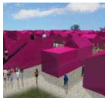
Make it right – Progetti per New Orleans

Clicca su un'immagine per aprire la galleria fotografica (7 foto)