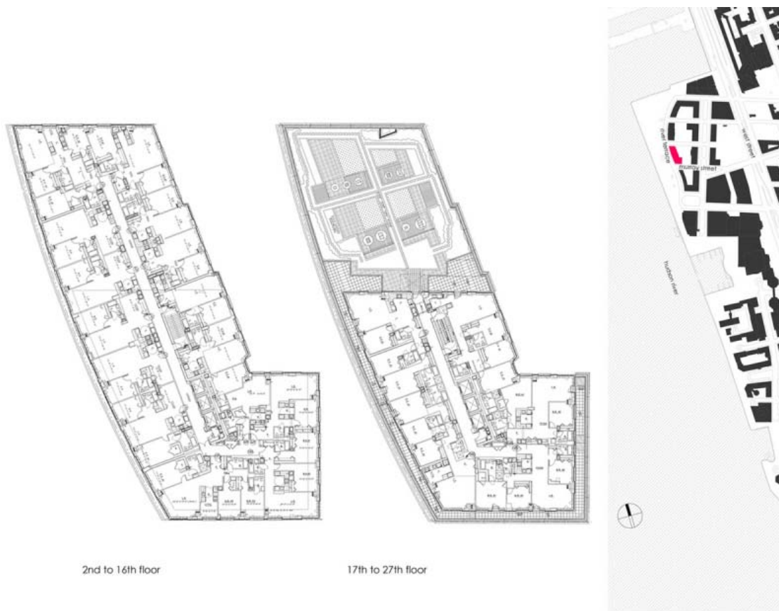
Cesar Pelli & Associates

I committenti dell'edificio hanno tenuto conto dei futuri costi di adeguamento alle nuove esigenze e hanno scelto di investire di più in qualità e in una vita più lunga dell'edificio. L'edificio è una costruzione a telaio in cemento armato con piani che offrono un massimo di flessibilità nella suddivisione e nell'eventuale ridisposizione degli appartamenti e quindi di adeguamento a futuri usi residenziali. La durata di vita dell'edificio è prevista intorno a 75-100 anni, quindi più lunga di quella di molti altri edifici residenziali di New York.