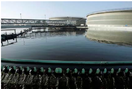
Depuratore nell'Orange County Water District. Il nuovo impianto è costato un mezzo miliardo di dollari.

(18-01-2009) Nella Fountain Valley, in California si può visitare un gigantesco impianto di depurazione. Al suo centro si trovano tre vasche spumeggianti. Il liquido in una di queste è di colore marrone sporco, nella seconda è giallo come urina e nella terza è limpido come l'acqua di fonte.