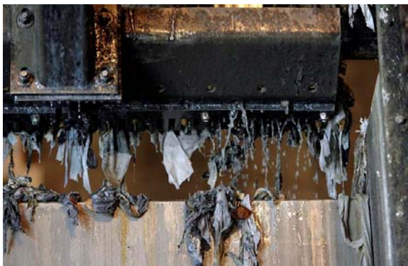
Prelievo di rifiuti dall’acqua reflua.

“E’ ,sì, uno spreco d’energia, commenta Markus, “perché l’acqua proveniente dall’impianto è più pulita di quella di falda”. Egli indica una serie di grandi vasche in cui acqua marrone passa per tubi verticali e spiega: “Qui comincia la fase particolare della depurazione”. L’acqua depurata che prima veniva convogliata nell’Oceano Pacifico, passa ora per 45 minuti in un sistema di microfiltri che trattiene batteri, protozoi e particolato. I pori del filtro hanno un diametro di 0,2 micrometri – 600 volte più sottili di un capello.