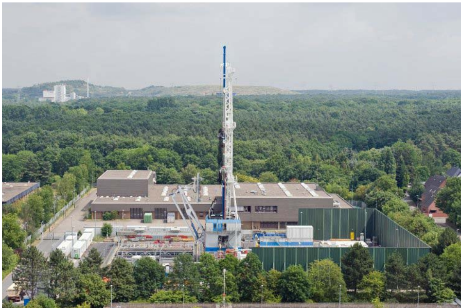
Il Geozentrum di Hannover.

Se l'esperimento dovesse riuscire, si otterrebbe un modello per sfruttare il calore della Terra in un'ampia area dell'Europa. In una striscia che va dalla Gran Bretagna fino in Polonia si trovano quasi le stesse condizioni geologiche come ad Hannover.