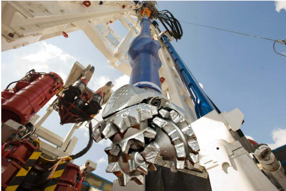
Trivella rotante usato nella trivellazione di profondità

separate. Il nuovo sistema consente quindi di dimezzare i costi relativi alla perforazione che così si sono potuti ridurre a circa nove milioni di Euro.