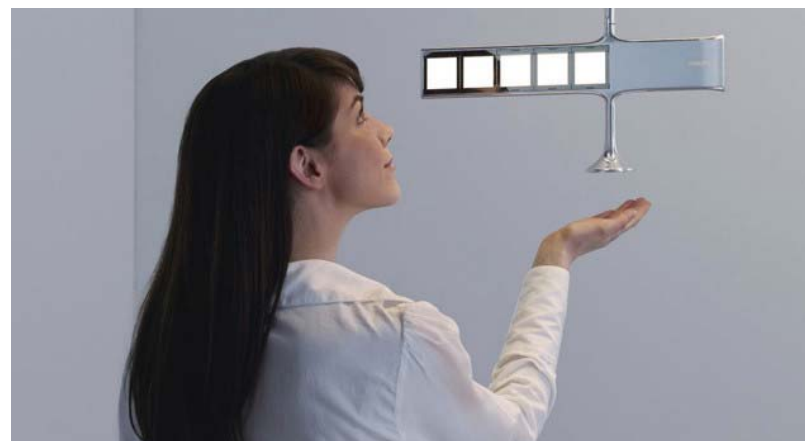
Il lampadario Philips