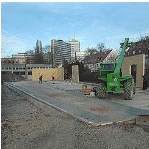
La scuola in fase di costruzione

Ingegneri: Ingenieurbüro Pankrath Nürnberg