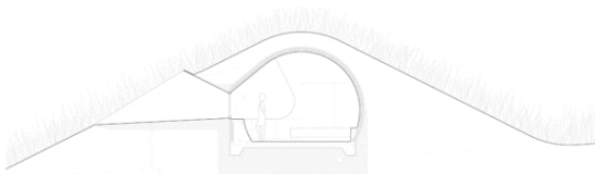
Building Section A - Window at Bedroom Drawing by [unreadable]