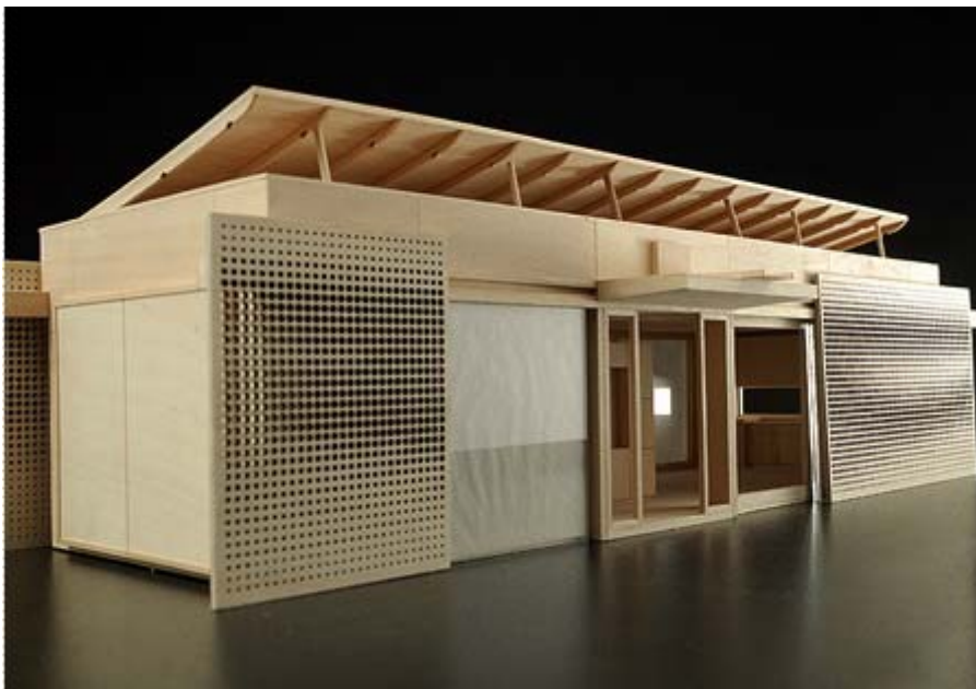
Primo Premio: LUMENHAUS del Virginia Polytechnic Institute & State University

Si è conclusa l'edizione 2010 del concorso internazionale Solar Decathlon bandito dallo statunitense Department of Energy (DOE) e aperto agli studenti di architettura di tutto il mondo.