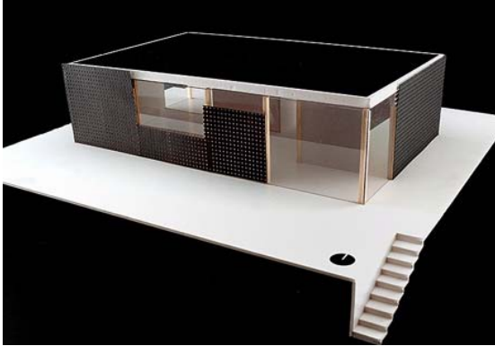
Secondo Premio: IKAROS della Fachhochschule Rosenheim (Germania)

Per ulteriori informazioni: www.sdeurope.org