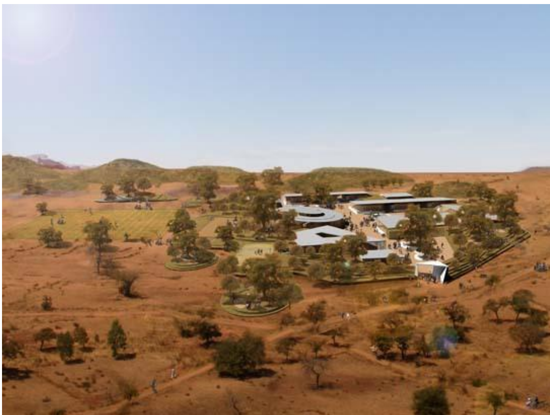
Primo premio (ORO): Scuola a Gando, Burkina Faso

Contemporaneamente a questi premi sono stati conferiti a Milano gli Holcim Awards per l'Europa . In considerazione del fatto che il comunicato stampa è redatto in italiano, ci limitiamo a indicare solo il sito Internet che ne riporta l'intero testo. ( http://www.holcimfoundation.org/T1345/A11EUmediaITA.htm ).