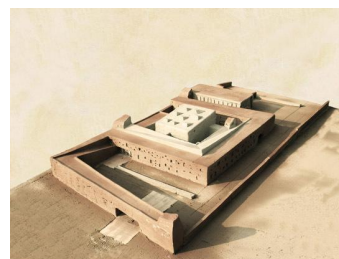
Holcim Awards 2011

(19-09-2011) La giuria ha comunicato i nomi dei progetti premiati che sono: