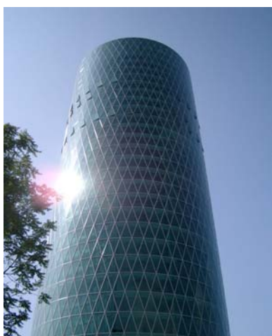
Il „bicchiere“ di Francoforte

Dalla competizione di presentare straordinarie forme architettoniche risultano anche delle stranezze e stravaganze come, per esempio, un edificio di Francoforte di 14.000 m 2 , ultimato nel 2003. Volendo a tutti i costi essere originale, l'architetto ha conferito alla facciata il design dei bicchieri dai quali, a Francoforte, si beve l'Apfelwein, il sidro locale. La facciata è di vetro verdastro che dovrebbe attenuare la luce, ma la riduce in maniera tale che si devono accendere le lampade durante tutto l'anno. Allora perché il vetro?