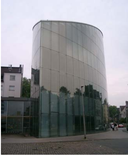
Business Promotion Centre di Duisburg

flusso può avvenire anche dall'alto verso il basso, mentre i progetti contano sul flusso dal basso verso l'alto. Le doppie facciate spesso "pompano" aria in modo non specifico.