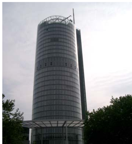
RWE Tower di Essen

I palazzi di vetro con doppie facciate "funzionano" meglio in estate rispetto ad edifici con un'unica facciata di vetro, ma il fatto non è dovuto alla "ventilazione naturale", bensì a quella artificiale. La doppia facciata non riduce, bensì aumenta il carico termico degli edifici, così come nel caso della RWE-Tower. La doppia facciata non influisce positivamente sul clima interno, che è invece mantenuto nell'intervallo sopportabile mediante impianti di climatizzazione o nuove tecnologie quali solai termoattivi raffreddati con l'acqua di falda e gruppi che raffreddano l'aria in entrata.