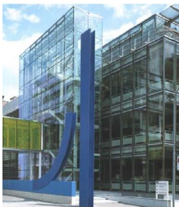
Centro odontoiatrico di Zurigo

Le entità dei consumi delle tre funzioni sono interdipendenti. È relativamente facile tenere bassi i fabbisogni termici in edifici amministrativi, perché gli apporti solari, il calore emesso dalle apparecchiature e dalle persone contribuiscono già in maniera notevole al riscaldamento. Il riscaldamento invernale è quindi di minore importanza, bisogna pertanto affrontare il grave problema estivo. Ed è proprio ciò che avviene attualmente nei palazzi di vetro. Le fonti interne di calore che contribuiscono al surriscaldamento non possono essere assolutamente rimosse in primavera e questo fatto si rispecchia, ad esempio, nell'alto fabbisogno di freddo e d'energia elettrica dell'edificio della Commerzbank.