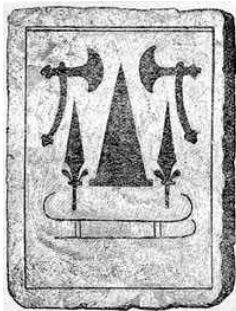
Il cono interpretato come cappello sulla pietra della Tomba di Kivik

Il cono è coperto di fasce e nastri decorativi con ornamenti a sbalzo: sono stati utilizzati 21 diversi timbri e 6 differenti ceselli. In base ad un confronto degli ornamenti con altri di simili artefatti, il cono è oggi fatto risalire al periodo che va dal 1000 al 900 a.C., più o meno alla fine dell'età di bronzo nordico.