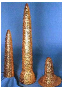
Cappelli d'oro (da sinistra a destra): di Avanton, (53 cm), di Ezelsdorf-Buch, e di Schifferstadt, (ambidue dalla Germania)

Oltre a quello di Berlino, a tutt'oggi, si conoscono solo tre altri coni d'oro.