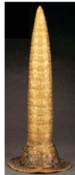
Il cappello d'oro di Berlino: astronomia per iniziati