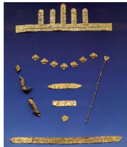
Elementi d'oro del vestito di Bernstorf, (distr. di Freising)

Nei pressi di Freising si trova, non lontano da Bernstorf, un castello risalente all'età del bronzo. Un'analisi dendrocronologica ha consentito di datare la struttura intorno al 1370 a.C. Nel 1998, in questo sito furono ritrovati, da un archeologo dilettante, dei pezzetti di lamiera d'oro. Questi pezzetti messi assieme, compongono, quasi per intero, un vestito dell'età del bronzo (XV - XIV secolo a.C.). Tuttavia, i singoli elementi (copricapo, pettorale, cintura, fibbia) sono troppo fragili per essere indossati da una persona, si pensa perciò che fossero applicati sul vestito di una statua di legno, a dimensione d'uomo, distrutta poi nel corso di un incendio. Gli elementi d'oro sono stati ritrovati seppelliti in una miscela di sabbia ed argilla.