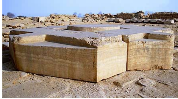
L'altare davanti al piedistallo dell'obelisco. La forma simboleggia le parole "Re sia soddisfatto".