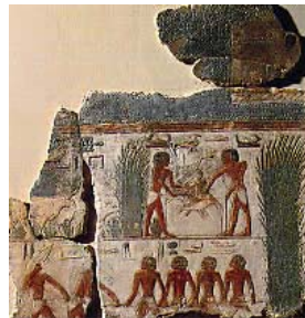
Due bassorilievi del tempio solare di Niuserre raffiguranti scene di attività agricola.