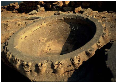
Una delle nove vasche collocate presso il muro orientale del cortile