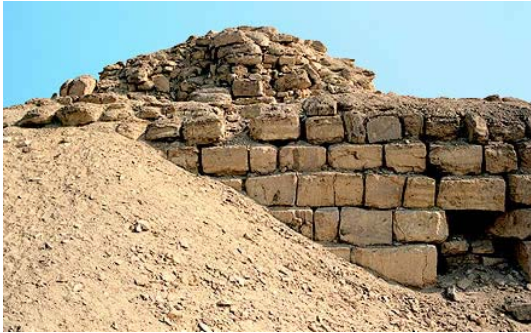
Ciò che è rimasto dalla piattaforma con il piedistallo dell'obelisco. Insieme, la costruzione si ergeva fino ad un'altezza di 56 metri.