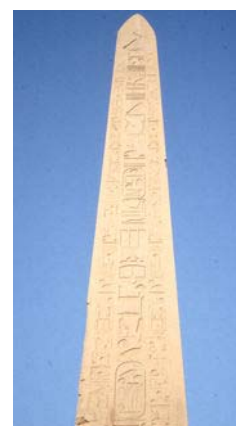
Obelisco di Luxor. L'obelisco rappresenta il raggio solare che collega il cielo con gli inferi.

Nelle religioni preislamiche indoiraniane, il Sole, ossia la luce del Sole, rappresentata simbolicamente dal fuoco assumeva un ruolo centrale, così come anche nel mitraismo.