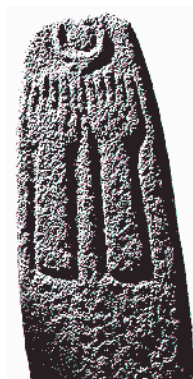
Stele dal tempio di Hazor