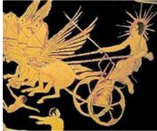
Helios auf dem Sonnenwagen (Vase, ca. 435 v.Chr.)

Nell'antica Grecia, Helios era venerato come dio-sole, che stando sul suo carro, ogni giorno, percorreva il firmamento. Dall'antica Grecia provengono anche le prime notizie di un'altra visione delle cose in cui il sole è considerato un oggetto della natura fisica. L'ipotesi più antica è forse quella attribuita a Senofane (ca. 570-475 AC.) che vedeva nel Sole un'esalazione o nube infuocata. Questa descrizione sembra oggi un po' naif, ma costituisce il primo passo fondamentale verso la teoria che considera il Sole un oggetto reale della natura e non parte di un'entità divina, convinzione che incontriamo anche in epoche più recenti.