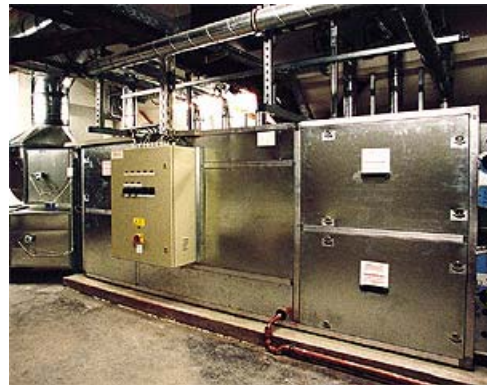
Impianto di ventilazione sotto il tetto

In due salotti è stato sperimentato anche un particolare intonaco che contiene al 10-25 % minuscole capsule con paraffina. In estate, questo cosiddetto accumulatore latente assorbe durante il giorno il calore senza aumentare la propria temperatura e lo restituisce all'aria durante la notte, quando le finestre sono aperte. L'intonaco contribuisce così a mantenere un clima equilibrato.