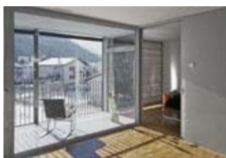
Veduta dal soggiorno verso il balcone