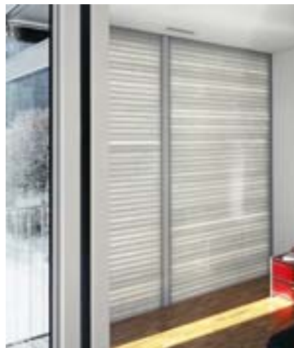
Interno di un alloggio per anziani

Sul lato sudovest si trovano dei locali che l'architetto chiama "Fensterräume" (locali delle finestre), uno spazio vetrato verso l'esterno e verso l'interno. Verso l'esterno vi sono delle ante scorrevoli, termicamente isolate e, verso l'interno anche delle finestre isolate termicamente. Nella stagione fredda, il locale delle finestre costituisce una specie di giardino d'inverno, mentre in estate assume funzione di balcone, mentre, nel corso di tutto l'anno, ha la funzione di procurare luce, sia al soggiorno che alla camera da letto. La camera da letto è un ampio locale secondario che confina con il soggiorno e il balcone, ma dall'esterno è separata dalla facciata translucida.