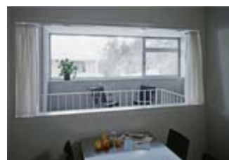
Veduta dalla cucina verso lo spazio di relazione

Architetti: Dietrich Schwarz, dipl. Arch. ETH SIA; Peter Silber, dipl. Arch. FH