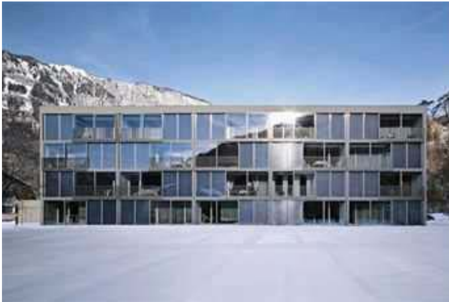
Figura 1 - Alloggi per anziani a Domat/Ems (CH)

L'architetto svizzero Dietrich Schwarz ha sviluppato una facciata che, grazie ad uno strato di cristalli di sale, accumula il calore del sole incidente e lo cede, in caso di bisogno, ai locali retrostanti. Un vetro prismatico impedisce il surriscaldamento estivo. La facciata è stata realizzata a Domat/Ems (CH) in un edificio che ospita 20 alloggi per anziani.