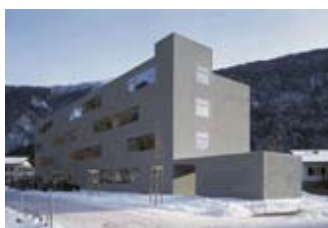
Veduta da nord

L'edificio corrisponde allo standard energetico svizzero "Minergie" ed è certificato come tale dall'Ufficio cantonale per l'Ambiente.