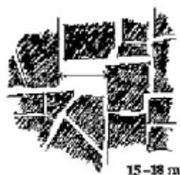
A pattern language

Il concetto urbanistico prevede inoltre un massimo di partecipazione dei futuri abitanti, che dovrebbero avere l'opportunità di intervenire nella progettazione della propria abitazione.