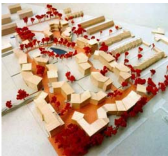
Plastico visto da Sud

140 unità abitative di differente taglio per 416 abitanti (persone singole, famiglie, anziani, comunità) su un'area di 26.700 m 2 (inclusi vie pedonali, stagno, ecc.).