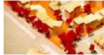
Il plastico visto da Est

L'idea fondamentale è stata quella di progettare un quartiere urbano senza auto. Possedere un'automobile comporta alti costi fissi e poi un tipo di automobile non si presta a tutti gli usi. Un'automobile di taglio medio è troppo grande per il trasporto di un'unica persona tra abitazione e luogo di lavoro, ma è spesso troppa piccola per trasportare tutta la famiglia in vacanza. Il progetto prevede pertanto che, in caso di necessità, gli abitanti possano noleggiare il veicolo più adatto. Si è calcolato che vivere senza auto, ma percorrere annualmente lo stesso tratto di 13.000 km in treno, tram, bus, car-sharing, taxi, bicicletta, a piedi e trasportare oggetti ingombranti, significa risparmiare mensilmente circa 75 - 150 Euro, e anche più; considerando che il risparmio sarebbe di 1.500 Euro/mese in caso di una Mercedes 600S.