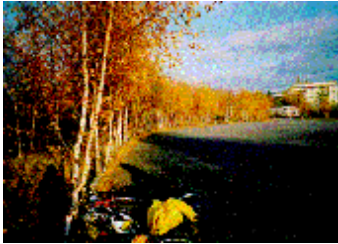
Il sito oggi