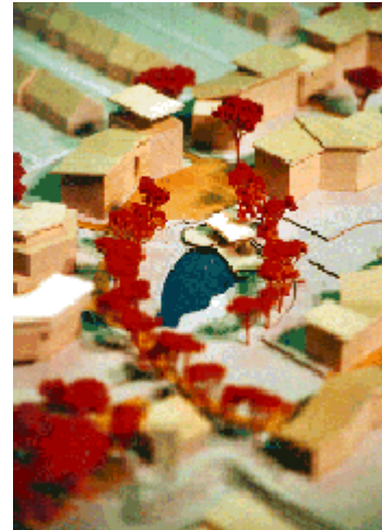
Gruppo con stagno

Il progetto prevede pertanto solo 36 parcheggi, invece dei 140 richiesti dal regolamento urbanistico. Ciò significa evitare la costruzione di circa 100 parcheggi che avrebbero dovuto essere realizzati solo con la costruzione di un'autorimessa interrata, ad un costo d'investimento di 100 \times 20.000 Euro = 2 milioni di Euro. I soldi risparmiati potranno essere investiti in altri servizi, per esempio abbassando il prezzo delle abitazioni in modo tale che anche famiglie con un reddito modesto possano acquistarne una.